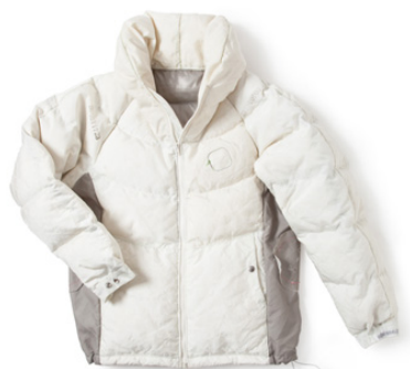
PiedPiper REBIRTH PROJECT