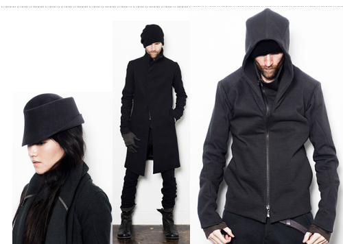
DEVOA Destruction and Construction

今回はキックオフプロジェクトとして、個性的な3つのブランドから、他では販売していないレアアイテムを「リアコレプロジェクトショップ」にご提供頂く事になりました。