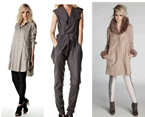
A DEGREE FAHRENHEIT